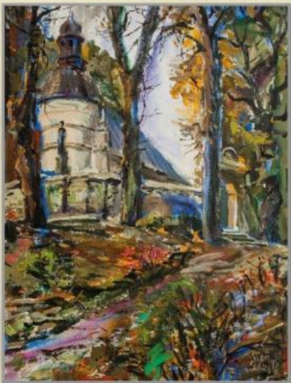
Jerzy Szemstobitow - Kościół na Grodzisku