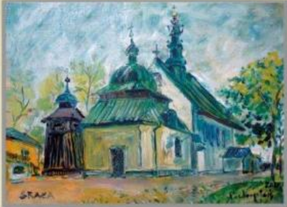
Adam Pochopiński - Kościół w Skale