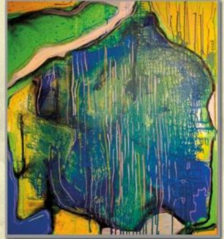
Aleksander Kubis - Czar ziemi, akril na płótnie, 90x80cm, 2017 rok