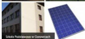
Skola Podstawowa w Cisowicach