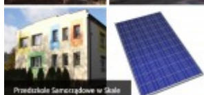
Przedszkole Samorządowe w Skała