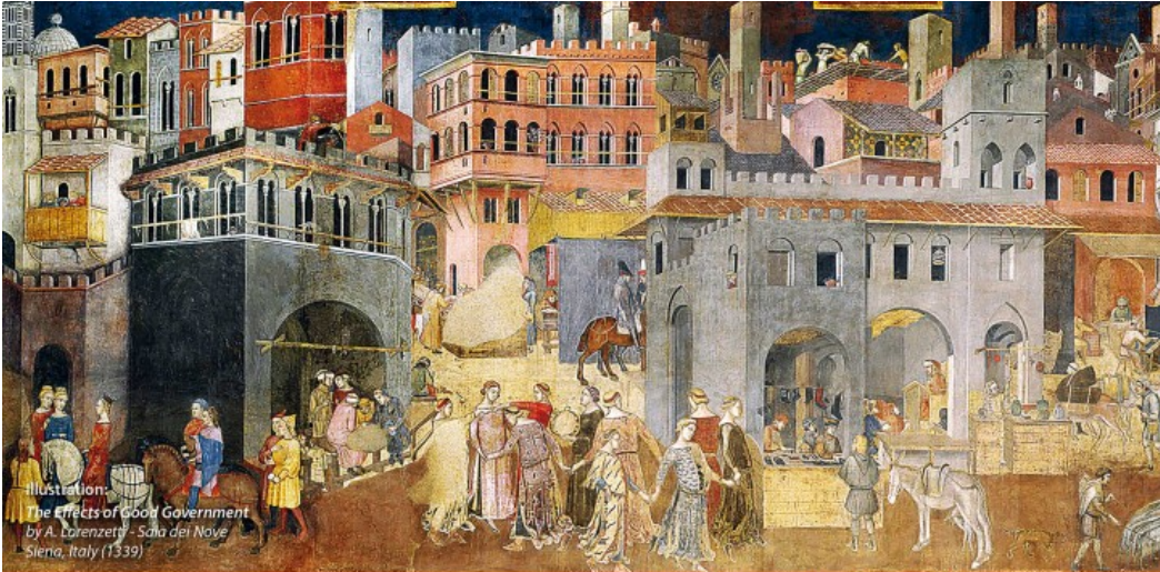
Illustration: The Effects of Good Government by A. Lorenzetti - Sala del Nove Siena, Italy (1339)