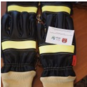
OLYMPUS DIGITAL CAMERA