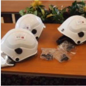
OLYMPUS DIGITAL CAMERA