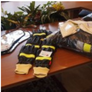
OLYMPUS DIGITAL CAMERA