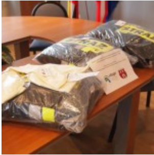
OLYMPUS DIGITAL CAMERA